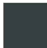
DB 703 ST Anthrazit